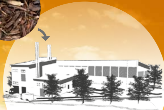
Naturwärmekraftwerk erzeugt Heißwasser